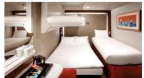
พัก 3-4 ท่าน