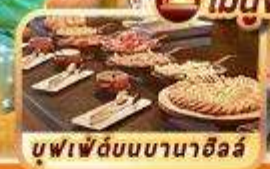
บุฟเฟ่ต์บนบานาฮิลล์