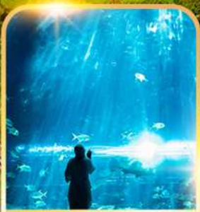
อควาเรียม