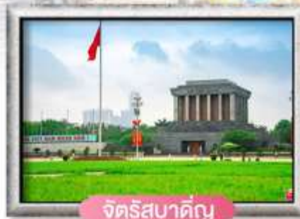
จัตุรัสบาตัญญู