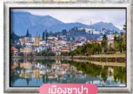
เมืองซาปา