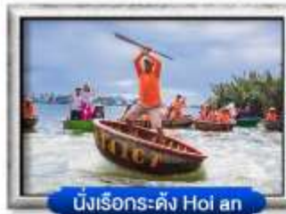
นั่งเรือกระดิง Hoi an