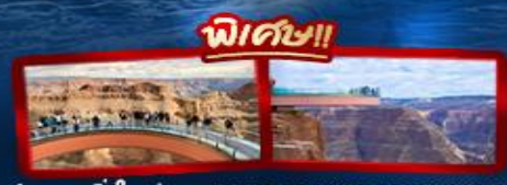
ชมความยิ่งใหญ่ของ GRAND CANYON WEST SKYWALK

อเมริกาตะวันตก ลอสแอนเจลิส ลาสเวกัส ซานฟรานซิสโก