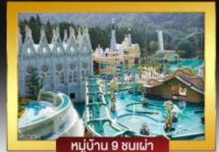
หมู่บ้าน 9 ชนเผ่า