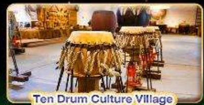
Ten Drum Culture Village