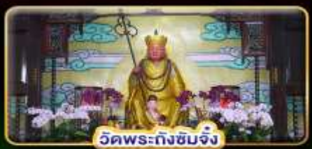
วัดพระถังซำจั๋ง

"ล่องเรือทะเลสาบสุริยันจันทรา" ขอความรักวัดหลงซาน