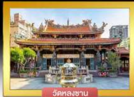
วัดหลงซาน