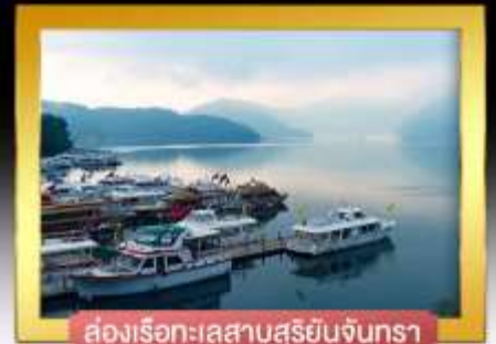
ส่องเรือทะเลสาบสุริยันจันทรา