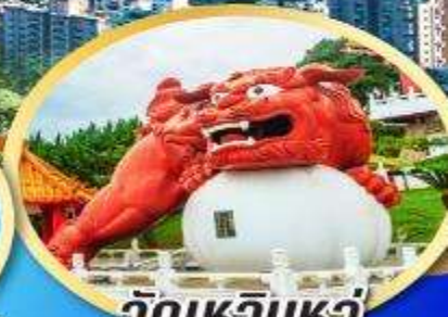
วัดเหวินหู่