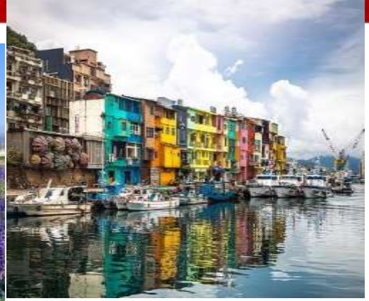
โปรแกรมเดินทาง 5 วัน 3 คืน CHINA AIR