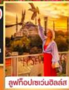
ลู่ฟทือปเซเวนฮิลล์ส