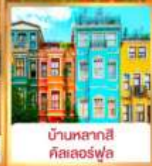
บ้านหลากสี คิสเลอร์ฟู