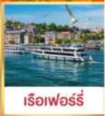
เรือเฟอร์รี่

เที่ยวครบเส้นทางยอดเยี่ยม บินเข้าถึงเย็น เช้าชมสุเหร่ายักษ์คามลิก้า และล่องเรือเฟอร์รี่ ชมเทศกาลทิวลิปแห่งนครฮิสตันบูล