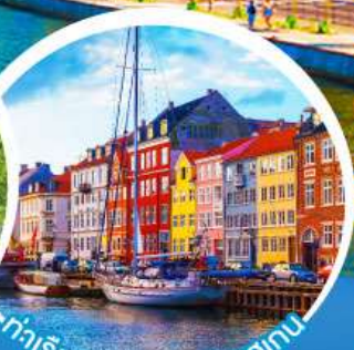
ท่าเรือฮวงวัน.โคเปนเฮเกน

เดินทาง 18-27 มี.ค. 68 10-19, 11-20 เม.ย. 68 02-11, 16-25 พ.ค. 68