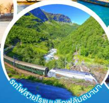
รถไฟสายโรแมนติกฟลินสบานา