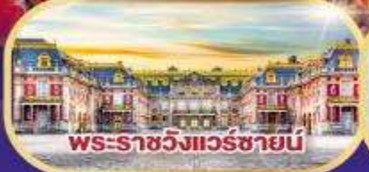
พระราชวังแวร์ซายน์