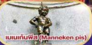
แมนกันพีส (Manneken pis)