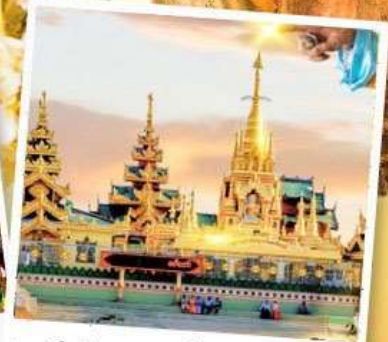
เจดีย์กลางน้ำ (สิริเยิม)