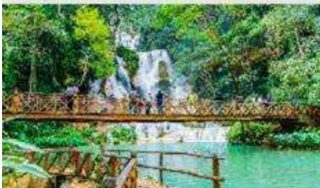
น้ำตกตาดกวางสี