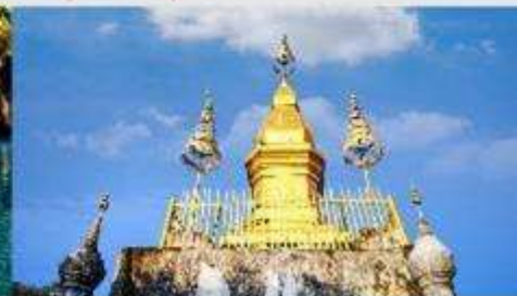
พระธาตุพูสี

*ทางบริษัทฯ ขอสงวนสิทธิ์ในการสลับโปรแกรมทัวร์ตามความเหมาะสมขึ้นอยู่กับสถานการณ์หน้างาน โดยคำนึงถึงผลประโยชน์ของลูกค้าเป็นสำคัญ