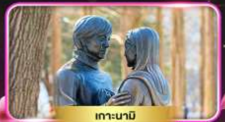
เกาะนามิ