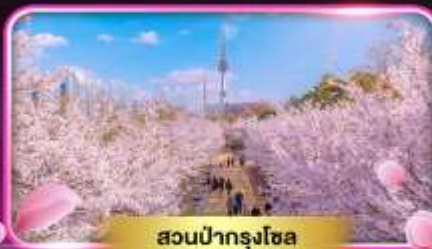
สวนป่ากรุงโซล