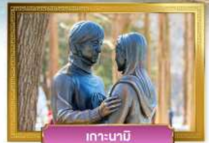
เกาะนามิ

เดินทางโดย : สายการบินแอร์เอเชียเอ็กซ์ (XJ)