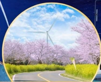
ซากุระ / ทุ่งดอกเรป