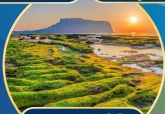
นาตดอชิงซีที