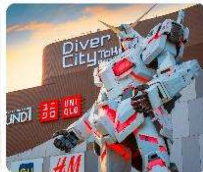
ย่านโอไดบะ ห้างไดเวอร์ซิตี ODAIBA SEASIDE PARK