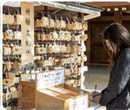
ศาลเจ้าเมจิจิงกู

ศาลเจ้าเมจิ หนึ่งในสถานที่อันศักดิ์สิทธิ์ใจกลางกรุงโตเกียว สิ่งแรกที่จะทำให้คุณประทับใจคือการเดินผ่านเสาโทริอิขนาดใหญ่ ระหว่างทางมีธรรมชาติที่ทำให้รู้สึกเหมือนก้าวเข้าสู่อีกโลกหนึ่ง ที่เต็มไปด้วยความสงบ อีกทั้งยังสามารถเขียนคำอธิษฐานลงบนแผ่นไม้ "เอมะ" เพื่อขอพรสำหรับความสุขและความสำเร็จในชีวิตอีกด้วย จากนั้นนำพาทุกท่าน... ซุปปังกันต่อใจกลางกรุงโตเกียว เมืองที่เป็นศูนย์กลางของแฟชั่นและนวัตกรรม และเปิดประสบการณ์การซูปปังที่ไม่เหมือนใคร! สักรวดย่านต่าง ๆ ที่แต่ละแห่งที่มีเสน่ห์และเอกลักษณ์อันโดดเด่น เมืองที่เต็มไปด้วยชีวิตชีวาและความทันสมัยที่หลากหลายอย่าง ย่านฮาราจุกุ แหล่งรวมแฟชั่นที่แปลกใหม่และสดใส เดินเล่นบน Takeshita Street ที่เต็มไปด้วยเสื้อผ้าและเครื่องประดับที่ไม่ซ้ำใคร เพลิดเพลินกับบรรยากาศสุดคูลที่เป็นเอกลักษณ์