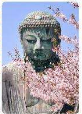
พระใหญ่ไดบุทสึ วัดโคโตคุอิน

จุดเด่นแห่งเมืองนี้คือ พระพุทธรูปองค์ใหญ่ไดบุทสึ (Daibutsu) หนึ่งในสัญลักษณ์ที่โดดเด่นที่สุดของ Kamakura พระพุทธรูปบронซ์ขนาดมหึมาที่วัดโคโตคุอิน (Kotoku-in) ที่มีความสูง 13.35 เมตร หนึ่งในพระพุทธรูปที่ใหญ่ที่สุดในญี่ปุ่น ไฮไลท์ของที่นี่คือการได้ชมความงามที่ตัดกันระหว่างพระพุทธรูปไดบุทสึขนาดใหญ่และต้นซากุระ ซึ่งปลูกอยู่ทั้งด้านหน้าและด้านหลังของพระพุทธรูป ทำให้เหมาะอย่างยิ่งกับการเดินเล่นและชมซากุระในบริเวณวัด เป็นอีกหนึ่งสถานที่ที่ต้องมาเยือนสักครั้ง หนึ่งในจุดไฮไลท์ของเมืองคามาคุระคือ ไม่ไกลกันพาเยือน เกาะเอโนชิมะ (Enoshima) เป็นเกาะที่ตั้งอยู่ในจังหวัดคานากาวะ ประเทศญี่ปุ่น ซึ่งเป็นจุดหมายท่องเที่ยวยอดนิยมที่มีทิวทัศน์สวยงามและสถานที่ที่น่าสนใจมากมาย ทั้งชายหาดสวย และวิวทะเลที่งดงาม ในวันที่ท้องฟ้าโปร่งใสเรายังสามารถมองเห็นวิวของภูเขาไฟฟูจิได้อีกด้วย ด้านบนยังมี ศาลเจ้าเอโนชิมะ ที่มีความสำคัญในด้านความโชคดี โดยเฉพาะในเรื่องความรัก นอกจากนี้ยังมี หอคอยประภาคารเอโนชิมะ ที่ให้ทัศนียภาพ 360 องศา ของเมืองคามาคุระได้อีกด้วย