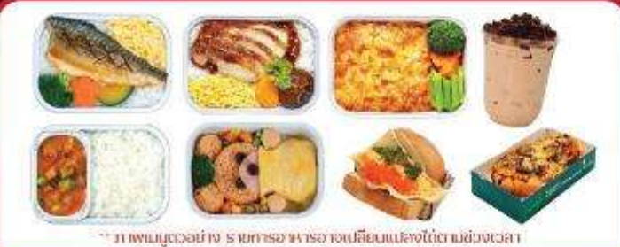
** ภาพเมนูตัวอย่าง รายการอาหารอาจเปลี่ยนแปลงได้ตามช่วงเวลา