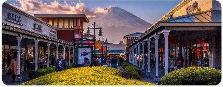
GOTEMBA PREMIUM OUTLETS

จากนั้นพาทุกท่านสู่.. Gotemba Premium Outlets ห้างเอาท์เลตที่มีขนาดใหญ่ที่สุดในญี่ปุ่น ตั้งอยู่ที่ ฮาโกเน่ จังหวัดคานากาวา ของประเทศญี่ปุ่น เป็นแหล่งช้อปปิ้งที่มีทั้ง แบรินด์ในประเทศและแบรินด์ ต่างประเทศ ถ้าอยากจะหาของอะไรให้มาที่นี่ได้เลย อีกทั้งในบริเวณนี้ ยังเป็นทางผ่านไปเที่ยว ภูเขาไฟฟูจิ และ ทะเลสาบฮาโกเน่ อีกด้วย และยังสามารถมองเห็นภูเขาไฟฟูจิได้จากตรงนี้แบบชัด ๆ ไปเลย คือเดินช้อปปิ้งไปเราก็ จะเห็นจุดพิกิดเอาไว้อชมวิวฟูจิสวย ๆ ไปด้วย เป็นอีกสถานที่ที่อยากให้สายเที่ยว สายช้อปปิ้งได้มาชมวิวและละลาย ทรัพย์กันอย่างมากมายจริง ๆ