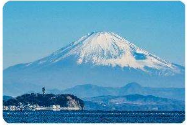
เกาะเอโนะชิมะ

เมืองคามาคุระ (Kamakura) เมืองน่ารักติดทะเล ตอบโจทย์ที่เที่ยวที่ผสมผสานระหว่างประวัติศาสตร์ ธรรมชาติ และความงามของทะเล บอกเลยใครมาต้องตกหลุมรักกับเมืองสุดชิล อย่าง คามาคุระ เมืองเล็กๆ ที่ตั้งอยู่ทางตอนใต้ของจังหวัดคานากาวะ ห่างจากโตเกียวเพียงแค่ 1 ชั่วโมง เท่านั้น แต่เต็มไปด้วยสถานที่ท่องเที่ยว ทิวทัศน์ธรรมชาติ และชายหาดที่งดงาม ที่นี้จะทำให้ทุกคนรู้สึกเหมือนได้ย้อนกลับไปสัมผัสประวัติศาสตร์ญี่ปุ่นในยุคซามูไร พร้อมทั้งได้ผ่อนคลายท่ามกลางบรรยากาศที่เงียบสงบและสดชื่น