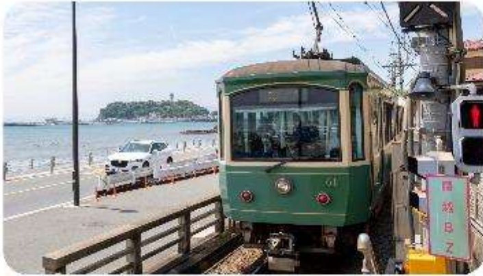
เมืองคามาคุระ