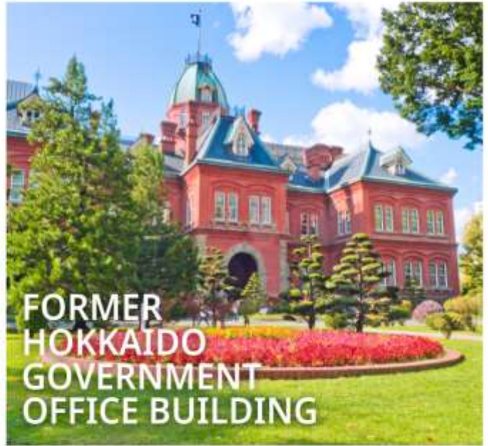
FORMER HOKKAIDO GOVERNMENT OFFICE BUILDING

เป็นตึกสไตล์นีโอบารอก มีลักษณะพิเศษที่มีหลังคายอดแหลมและกรอบหน้าต่างเป็นเอกลักษณ์ เปรียบเสมือนอนุสาวรีย์การบุกเบิกของฮอกไกโด ปัจจุบันได้รับการขึ้นทะเบียนเป็นมรดกทางวัฒนธรรมของชาติ