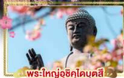
พระใหญ่อุซึคุโอบุคซึ