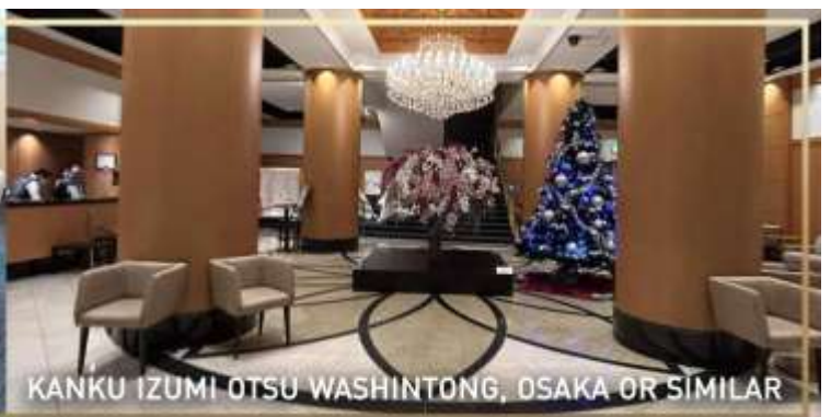
KANKU IZUMI OTSU WASHINTONG, OSAKA OR SIMILAR