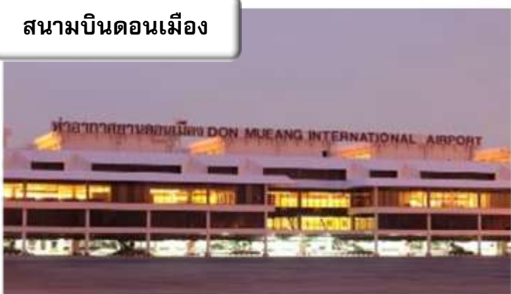
สนามบินดอนเมือง

เวลา 22.00 น.พร้อมกันที่ สนามบินดอนเมือง อาคารผู้โดยสารขาออกระหว่างประเทศเคาน์เตอร์ สายการบินไทยแอร์เอเชียเอ็กซ์เจ้าหน้าที่คอยให้การ ต้อนรับ ดูแลด้านเอกสาร เช็คอิน และสัมภาระใน การเดินทาง