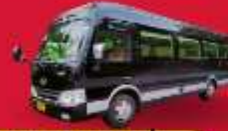
BUS (10-18 ท่าน)