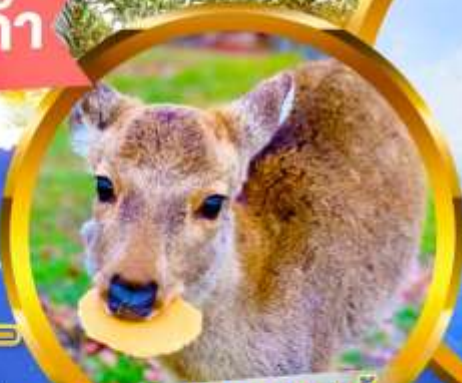
พิเศษสุด!! ชมเขมเป็ สำหรับป้อนน้องกวางทำนละ 1 ชุด

นั่งกระเช้าลอยฟ้าบิวาโกะ ตี๋มค้ำกับวิวสวย 360° กิจกรรมให้ชมเขมเป็กกับกวาง ณ เมืองนารา ช้อปปิ้งเอาท์เล็ตมอลล์ที่ใหญ่ที่สุดในนาโกย่า สัมผัสหมู่บ้านมรดกโลก ชิราคาวาโกะ