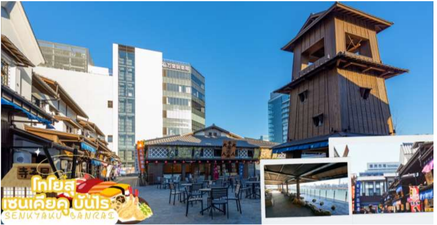
กลางวัน รับประทานอาหารกลางวัน ณ ร้านอาหาร (มือที่ 6)