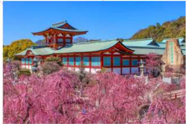
HOFU TENMANGU SHRINE