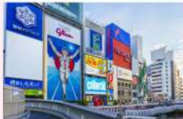
SHOPPING AT SHINSAIBASHI