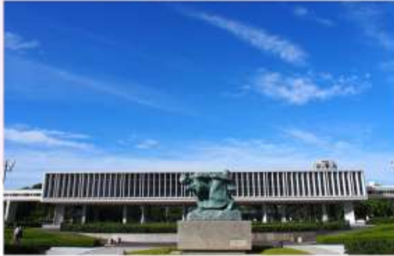
HIROSHIMA PEACE MEMORIAL MUSEUM

"พิพิธภัณฑ์สันติภาพฮิโรชิมา" ถูกสร้างขึ้นเพื่อเป็นอนุสรณ์และรำลึกถึงเหตุการณ์ระเบิดปรมาณูที่เกิดขึ้นในวันที่ 6 สิงหาคม พ.ศ. 2488 พิพิธภัณฑ์แห่งนี้เปรียบเสมือนห้องเรียนขนาดใหญ่ที่รวบรวมเรื่องราวและหลักฐานทางประวัติศาสตร์ที่น่าสะท้อใจของเหตุการณ์ระเบิดปรมาณู ผ่านภาพถ่าย วัตถุโบราณ และคำบอกเล่าของผู้รอดชีวิต