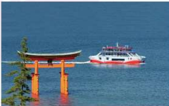
TAKE FERRY & VISIT ITSUKUSHIMA SHRINE

"ศาลเจ้าอิซุกุชิม่า" เป็นหนึ่งในแลนด์มาร์คที่สำคัญของญี่ปุ่น ตั้งอยู่บนเกาะมิจิมา จังหวัดอิริชิม่า โดยมีเอกลักษณ์ที่โดดเด่นคือ ประตูกุโรอิขนาดใหญ่ที่ตั้งอยู่กลางทะเล ทำให้ศาลเจ้าแห่งนี้ดูลึกลับและสวยงามเป็นอย่างยิ่ง และได้รับการขึ้นทะเบียนเป็นมรดกโลกโดยองค์การยูเนสโกด้วย