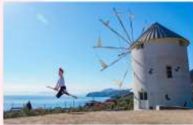
SHIDOSHIMA OLIVE PARK