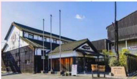
MARUKIN SOY SAUCE MUSEUM

หนึ่งในไฮไลท์ที่พลาดไม่ได้เมื่อมาเยือนพิพิธภัณฑ์แห่งนี้ คือ "โถงศรีมซอพต์เสิร์ฟซอสถั่วเหลือง" รสชาติที่ผสมผสานความหอมหวานของโถงศรีมกับความเค็มกลมกล่อมของซอสถั่วเหลืองได้อย่างลงตัว เป็นรสชาติที่แปลกใหม่และน่าสนใจ (บริการฟรี ท่านละ 1 โถง)