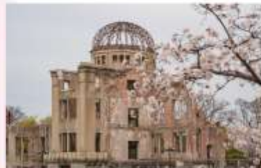
ATOMIC BOMB DOME