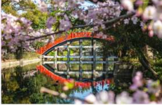
SUMIYOSHI TAISHA SHRINE