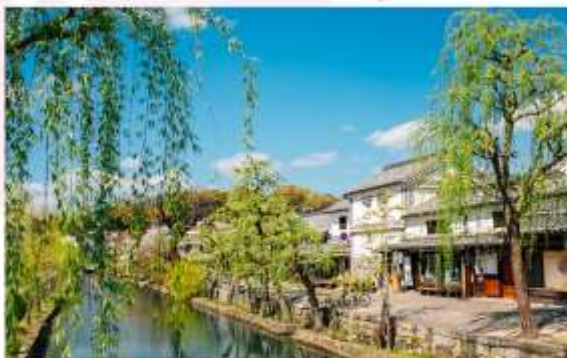
KURASHIKI BIKAN HISTORICAL QUARTER

"ศูนย์ประวัติศาสตร์ คุราชิกิ บิกัง" ย่านเมืองเก่าที่งดงามริมคลองในเมืองคุราชิกิ มีเอกลักษณ์โดดเด่นด้วยอาคารโกดังสีขาวริมคลองบรรยากาศเย็นสงบ และความหลากหลายทางวัฒนธรรมที่ผสมผสานระหว่างญี่ปุ่นและตะวันตกได้อย่างลงตัว