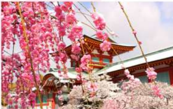
HOFU TENMANGU SHRINE