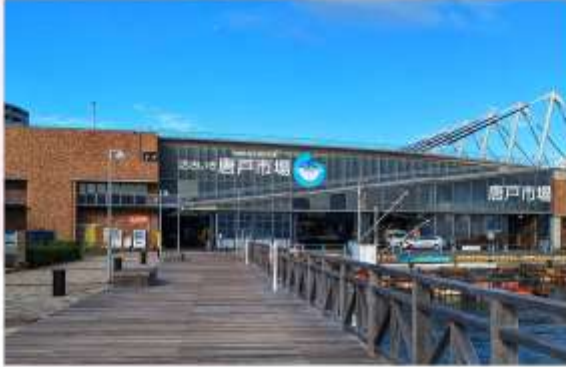
KARATO FISH MARKET

“ตลาดปลาคาราโตะ” เป็นตลาดปลานขนาดใหญ่ มีชื่อเสียงเรื่องความสดใหม่ของอาหารทะเล โดยเฉพาะปลาปักเป้า ปลาโท และปลาฮามาจิ ที่เป็นของดีประจำถิ่น สืบลองซูชิที่ทำจากวัตถุดิบสดๆ ส่งตรงจากทะเล พร้อมชนบทบรรยากาศตลาดปลานญี่ปุ่นที่คึกคักและมีชีวิตชีวา