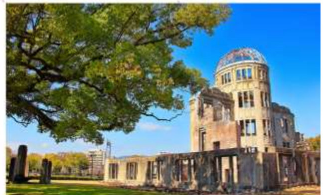
รับประทานอาหารกลางวัน ณ กัดตาคาร