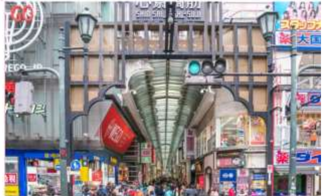
อิสระอาหารกลางวันตามอัธยาศัย (ไม่รวมในรายการ)