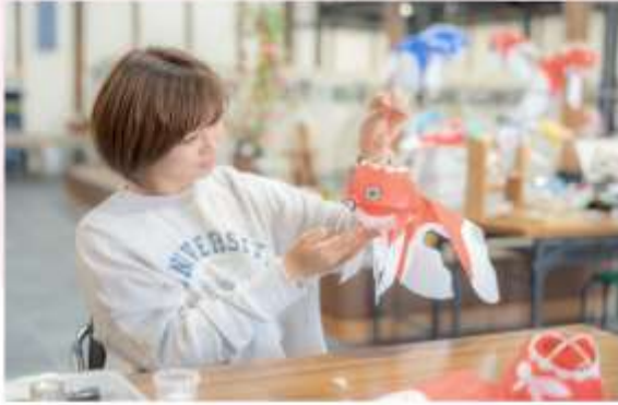
GOLDFISH LANTERN MAKING