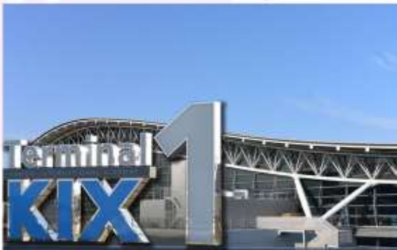
KANSAI INTERNATIONAL AIRPORT