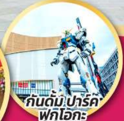
กันดั้ม ปาร์ค ฟุกุโอกะ