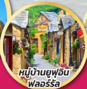
หมู่บ้านยูฟูอิน ฟลอร์ริล