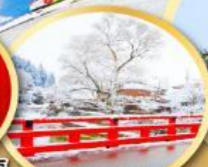
สะพานนากะบาชิ