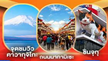
จุดชมวิวกาวากูจิโกะ ถนนนากามิเซะ ชินจุกุ

อิสระท่องเที่ยวตามอัธยาศัย หรือเลือกซื้อทัวร์เสริมโตเกียวดิสนีย์แลนด์ วัดอาซากุสะ ถนนนากามิเซะ พิพิธภัณฑ์แผ่นดินไหว จุดชมวิวกาวากูจิโกะ ลานสกีฟูจิเก็บ กันดั้ม ไอโดบะ ไคโวจีโร่ ซุปปิ้งชินจุกุ