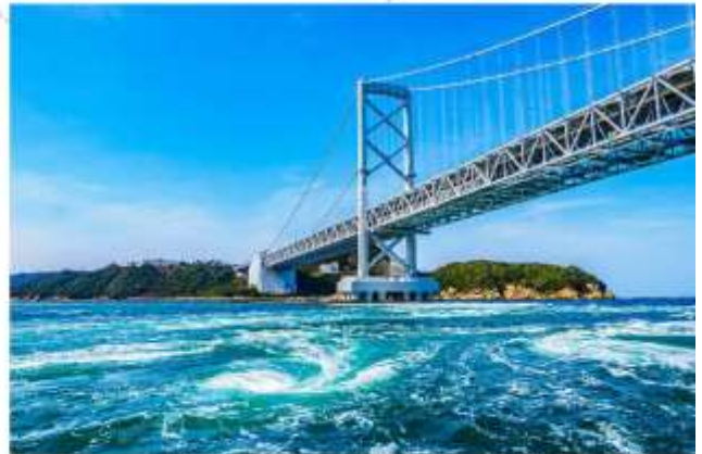
UZU NO MI CHI (WALK WAY)