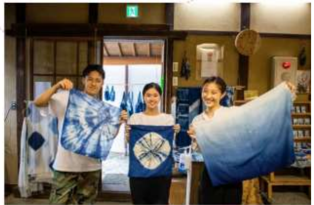
รับประทานอาหารกลางวัน ณ กัตตาคาร