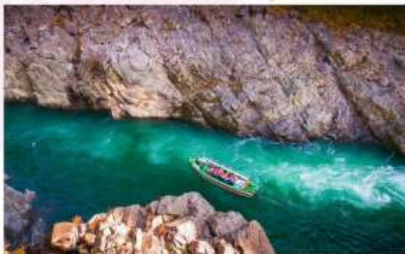
TAKE BOAT AT OBOKE KOBOKE