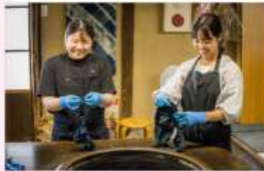
MAKE INDIGO DRING