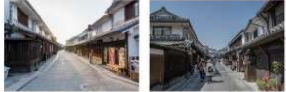
รับประทานอาหารกลางวัน ณ ภัตตาคาร