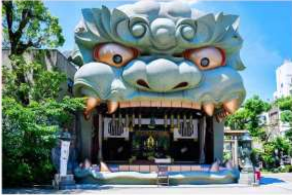
YASAKA NAMBA SHRINE