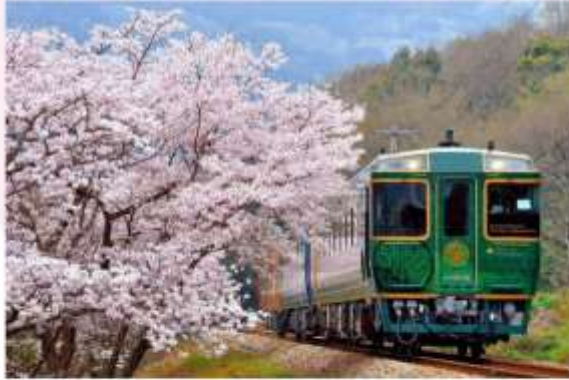
SHIKOKU MANNAKA SENNEN MONOGATARI