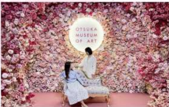
OTSUKA MUSEUM OF ART