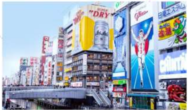
รับประทานอาหารกลางวัน ณ กิตตาคาร