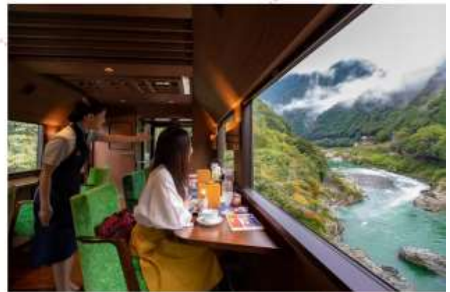
รับประทานอาหารกลางวัน ภายในรถไฟ (เมนูอาหารไม่สามารถเปลี่ยนได้)