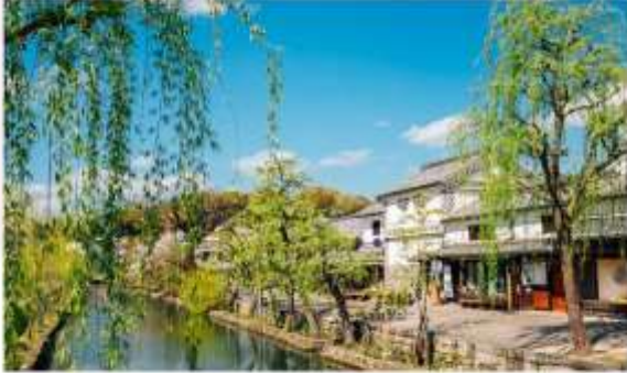
KURASHIKI BIKAN HISTORICAL QUARTER