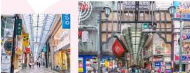
SHOP AT SHINSAIBASHI

สวรรค์ของนักช้อป "ย่านชินโซบาชิ" ถนนคนเดินที่ยาวกว่า 600 เมตร เต็มไปด้วยร้านค้ามากมายกว่า 200 ร้าน ให้คุณได้ช้อปปิ้งบิงเฟลน ไม่ว่าจะเป็นเสื้อผ้าแฟชั่น เครื่องสำอาง ร้านขายยา ร้านคองกิโฮเตะ-ร้าน 100 เยน ร้านอาหาร คาเฟ่ ของฝาก ครบครัน