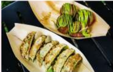
UJI MATCHA STREET