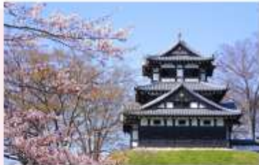
TAKADA CASTLE SITE PARK