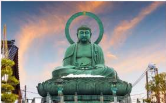
TAKAOKA GREAT BUDDHA

ขอพร “พระใหญ่ทาคาโอกะ หรือ ทาคาโอกะโคบุตสึ” เป็นหนึ่งในพระพุทธรูปทองสัมฤทธิ์ที่ใหญ่และสวยงามที่สุดในญี่ปุ่น ตั้งอยู่ในเมืองทาคาโอกะ พระพุทธรูปองค์นี้มีความสูงถึง 16 เมตร สร้างจากทองสัมฤทธิ์ที่ผลิตในท้องถิ่น และใช้เวลาสร้างนานถึง 26 ปี