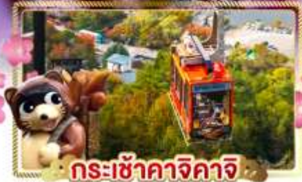
กระเช้าคางิจิกายิ