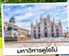
มหาวิหารคูโอโน