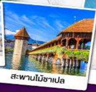
สะพานไม้ซาเปลา