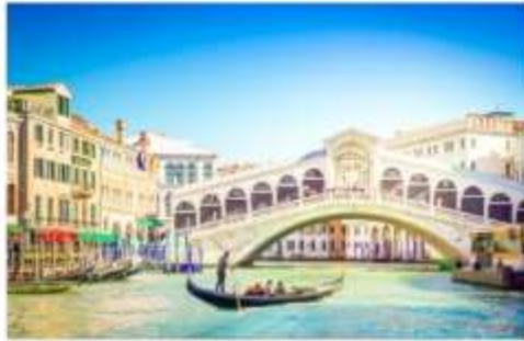
สะพานรีอัลโต