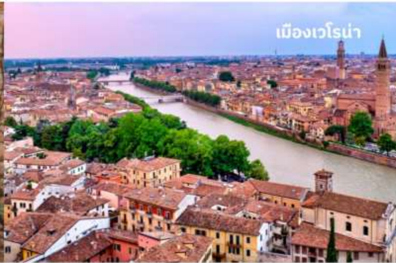
เมืองเวโรน่า