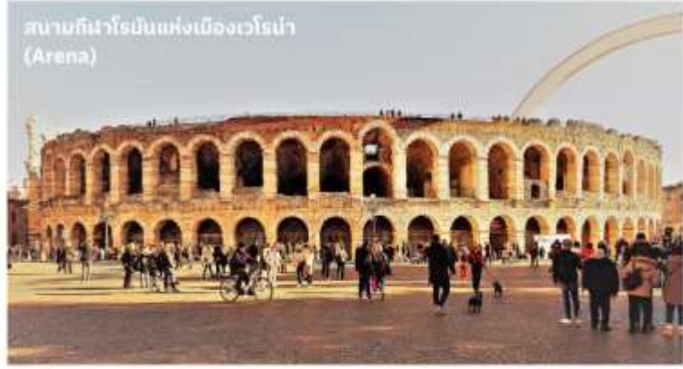
สนามกีฬาโรมันแห่งเมืองเวโรน่า (Arena)