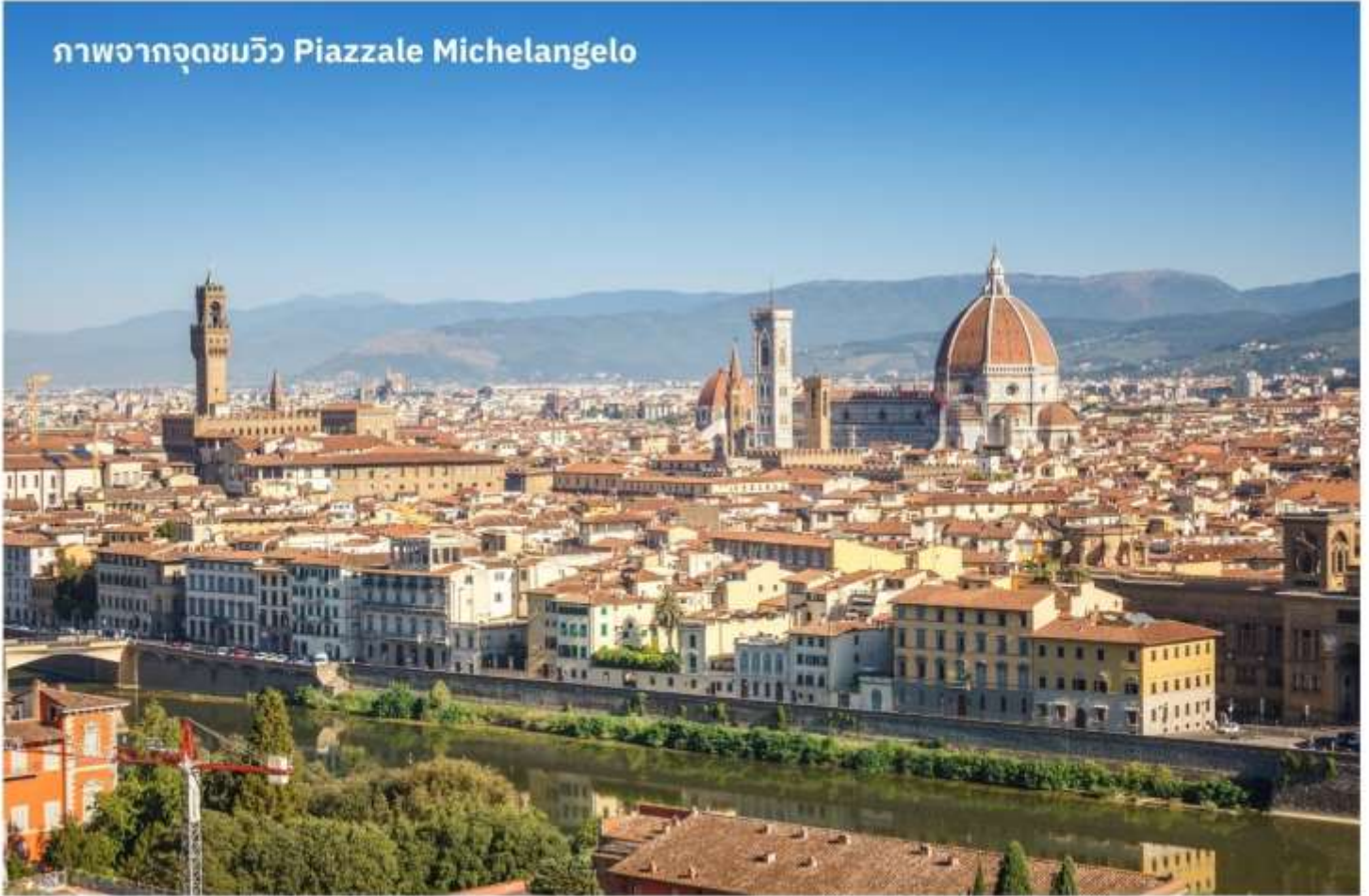
ภาพจากจุดชมวิว Piazzale Michelangelo

เมืองฟลอเรนซ์ ตั้งอยู่ทางตอนเหนือของประเทศอิตาลี เป็นเมืองที่มีชื่อเสียงในช่วงศตวรรษที่ 13-14 ซึ่งเป็นยุคที่เจริญรุ่งเรืองของวัฒนธรรมและศิลปะ อีกทั้งในอดีตยังมีความสำคัญทางการค้าและวัฒนธรรม มีสถาปัตยกรรมที่งดงามและเป็นที่มาของศิลปะโรแมนติกที่เจริญรุ่งเรืองอย่างมากในยุคนั้น นำท่านเดินทางไปยังเนินเขา Piazzale Michelangelo เพื่อชมวิวของเมือง Florence ที่นักท่องเที่ยวรวมไปถึงชาว Florence เอง มักขึ้นมาชมบรรยากาศในมุมสูงของเมือง ซึ่งจะเห็นหลังคาสีแดงของอาคารบ้านเรือนต่างๆ รวมไปถึง Duomo เรียงรายกันเป็นแนวสวยงามยิ่งนัก อีสาระให้ท่านเก็บภาพประทับใจตามอัธยาศัย