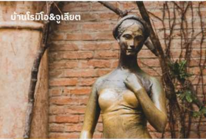
บ้านโรมิโอ&จูเลียต

ท่านสามารถทำการสแกน QR CODE นี้ เพื่อรับชม ที่เกี่ยวข้องในเมืองเวโรน่า ในรูปแบบวิดีโอ