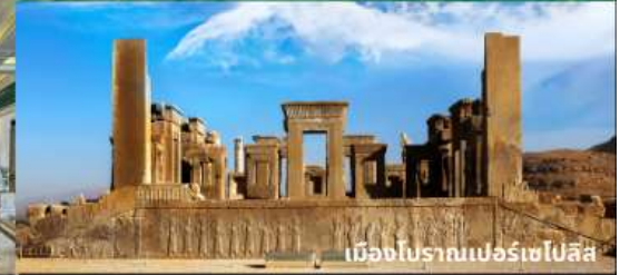
เมืองโบราณเปอร์เซโปลิส