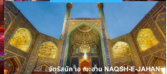
จัตุรัสบิก ไอ ฉะฮาน NAQSH-E-JAHAN