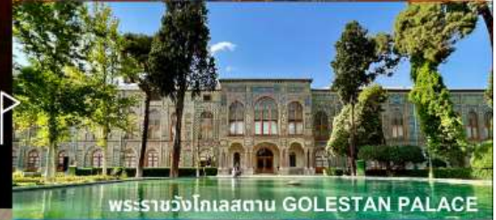
พระราชวังโกเลสถาน GOLESTAN PALACE