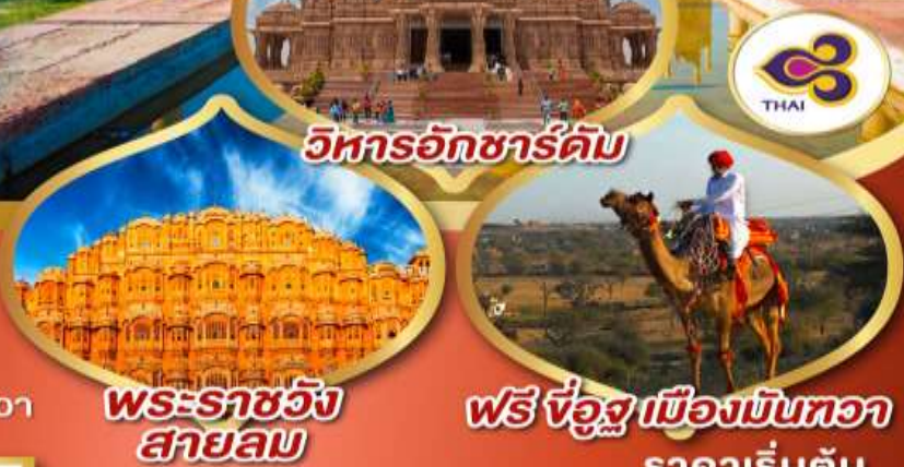
วิหารอักซาร์ดัม