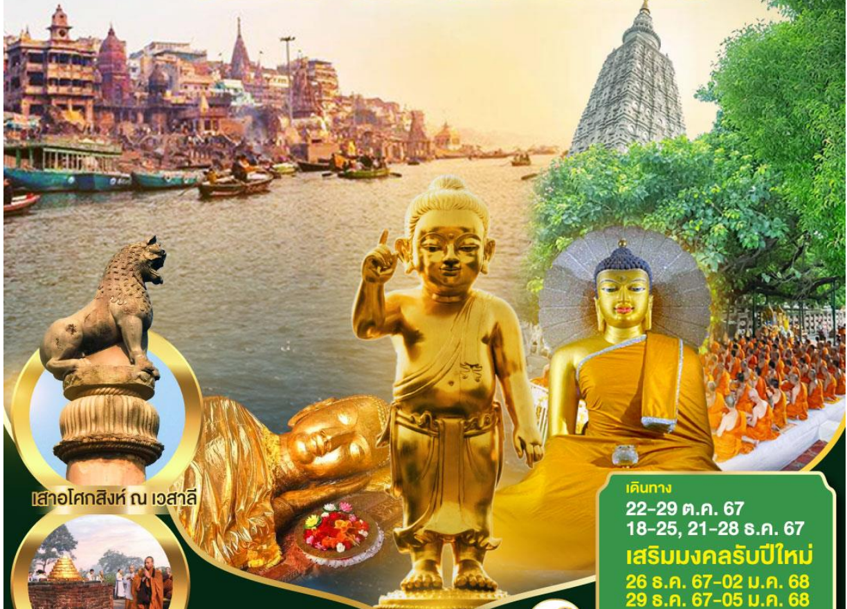
เสาอโศกสิงห์ ณ เวสาลี