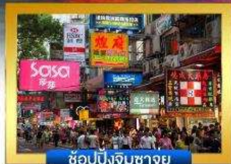
ช้อปปิ้งจิมซาจู้