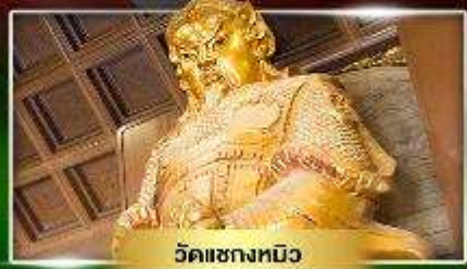
วัดเขกหมิว

ชมบันทึกหินนำโชควัดเขก ขี้มอวิธ "เจ้ากวนอิมฮ่องฮ่า"