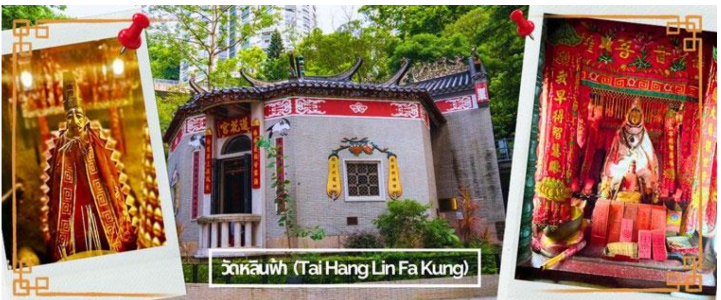
วัดหลินฟ้า (Tai Hang Lin Fa Kung)

จากนั้นนำท่านเดินทางสู่ วัดหลินฟ้า (LIN FA KUNG TEMPLE) หรือ วัดดอกบัว เป็นวัดจีนตั้งอยู่บริเวณ หวานจ้าย คอสเวย์เบย์ มีเจ้าแม่กวนอิม เป็นองค์ประธานของวัด สร้างขึ้นในปี 1863 มีตำนานเล่าว่า เจ้าแม่กวนอิมเคยปรากฏกายที่วัดแห่งนี้ เป็นที่เลื่อมใสของชาวบ้าน จึงร่วมใจกันสร้างวิหารลักษณะ คล้ายดอกบัวนี้ขึ้น และประดับด้วยโคมไฟดอกบัวร้อยโคม เมื่อมองเข้าไปด้านในวิหารจะทำให้รู้สึกถึงความเจริญรุ่งเรือง เปรียบเสมือนว่าแค่มาไหว้เจ้าแม่กวนอิมที่วัดแห่งนี้ก็ทำให้ผู้มาเยือนได้มีชีวิตที่เจริญรุ่งเรืองยิ่งขึ้นไป และยังมี เทพเจ้าสาวจื่อเอี้ยะ (เทพเจ้าสายนรก) เป็นเทพที่ขึ้นชื่อเรื่องความ กตัญญู และด้านเงินทอง ผู้ใดที่ได้ไปไหว้ขอพรท่าน เชื่อว่าจะทำให้มีโชคลาภแบบไม่คาดคิด และสมหวัง อย่างรวดเร็ว ใครที่ชอบเสี่ยงโชค เสี่ยงดวง ห้ามพลาดเลยทีเดียว