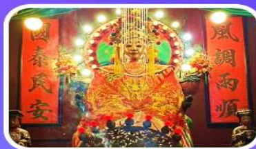
วัดเจ้าแม่กวนอิมเทียนหัว