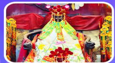
วัดเจ้าแม่กวนอิมสองอ่า