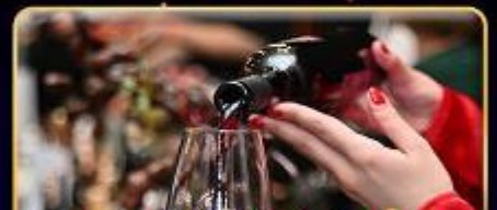
พิเศษ!! ซิมไวน์ท้องถิ่น