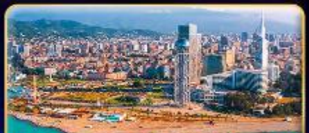
ส่องเรือทะเลสาบค้ำชมอ่าวบากูมี