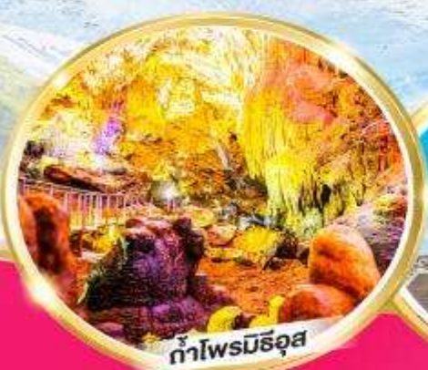
กำโพรมิธอส