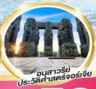
อนสาวรีย์ ประวัติศาสตร์จอร์เจีย