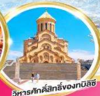
วิหารศักดิ์สิทธิ์ของทบิลีซี