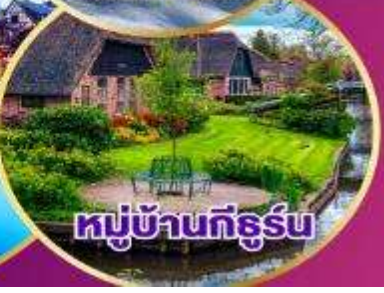
หมู่บ้านกังธูร์น