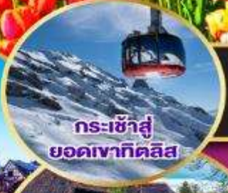
กระเช้าสู่ออกเขาทิกลิส