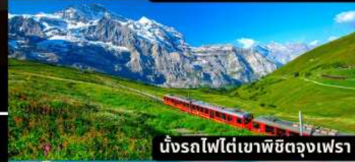
นั่งรถไฟใต้เขาพิชิตดงเฟรา