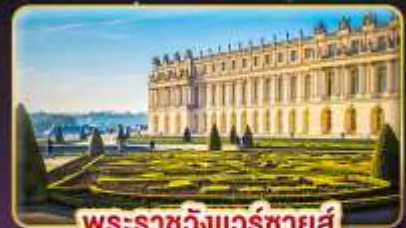
พระราชวังแวร์ซายส์