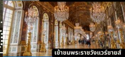
เข้าชมพระราชวังแวร์ซายส์