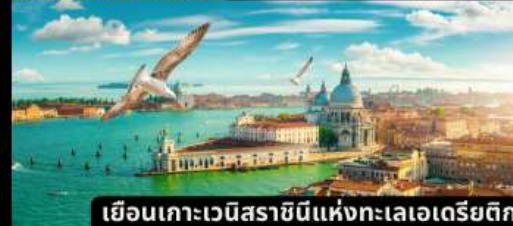
เยือนเกาะเวนิสราชมินแห่งทะเลเอเดรียติก