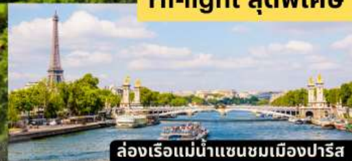
ล่องเรือแม่น้ำแซนชมเมืองปารีส