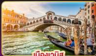
เมืองเวนิส