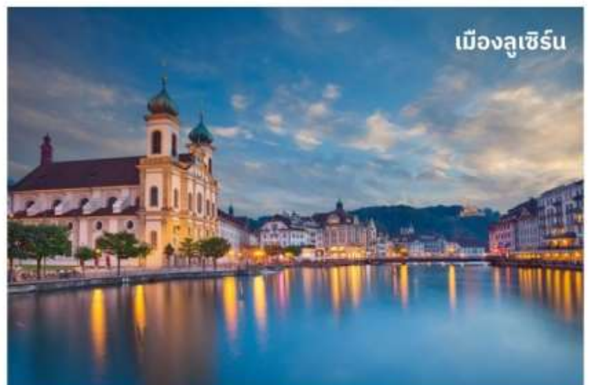
เมืองลูเซิร์น