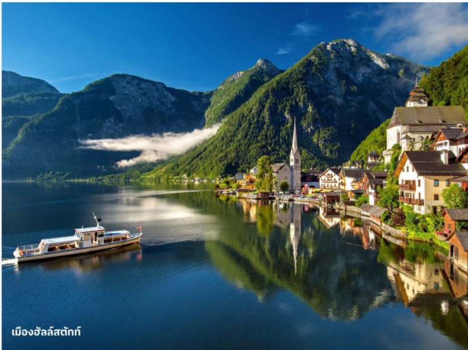
เมืองฮัลล์สตัดท์