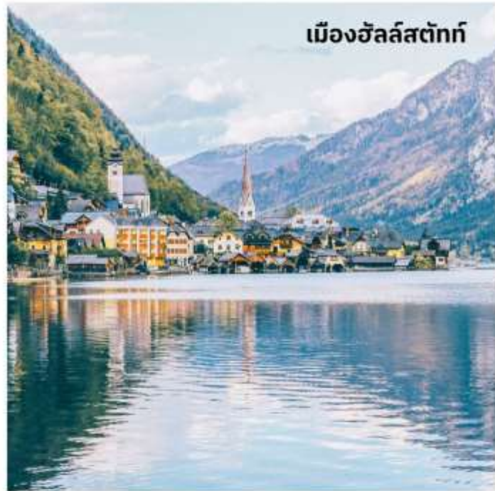
เมืองฮัลล์สตัดท์

ออสเตรียให้ฉายาเมืองนี้ว่าเป็นไข่มุกแห่งออสเตรีย และเป็นพื้นที่มรดกโลกของ UNESCO เพียงเดินเที่ยวชมเมืองก็เสมือนหนึ่งท่าน อยู่ในภวังค์แห่งความฝัน